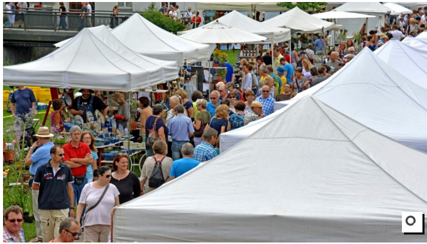
An ihre Grenzen stoßen die Veranstalter, wenn sie im August die Aussteller des Töpfermarktes auf dem Areal des Veranstaltungsforums Fürstenfeld unterbringen wollen. Aber es gelingt immer wieder.

Diese bunte Mischung spiegelt sich auch im Rahmenprogramm zum Markt wider. Jeweils von 11 bis 17 Uhr gibt es Samstag mittelalterliche Gaukelei und Sonntag europäische Bordunmusik zu genießen. An beiden Tagen wird zudem für Interessierte mit dem "Fiedelbogendrehkeln" in vor-moderne Technik